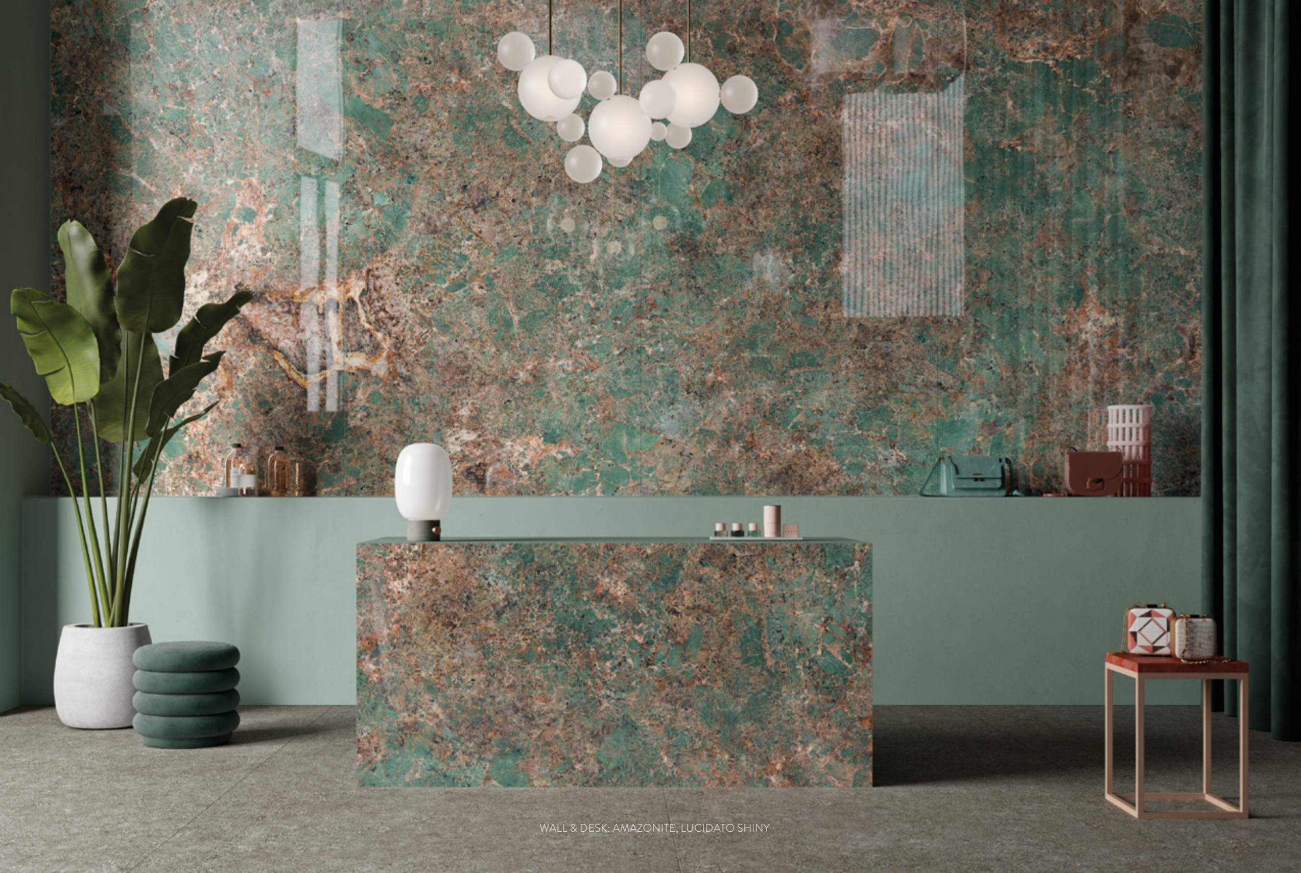
WALL & DESK: AMAZONITE, LUCIDATO SHINY