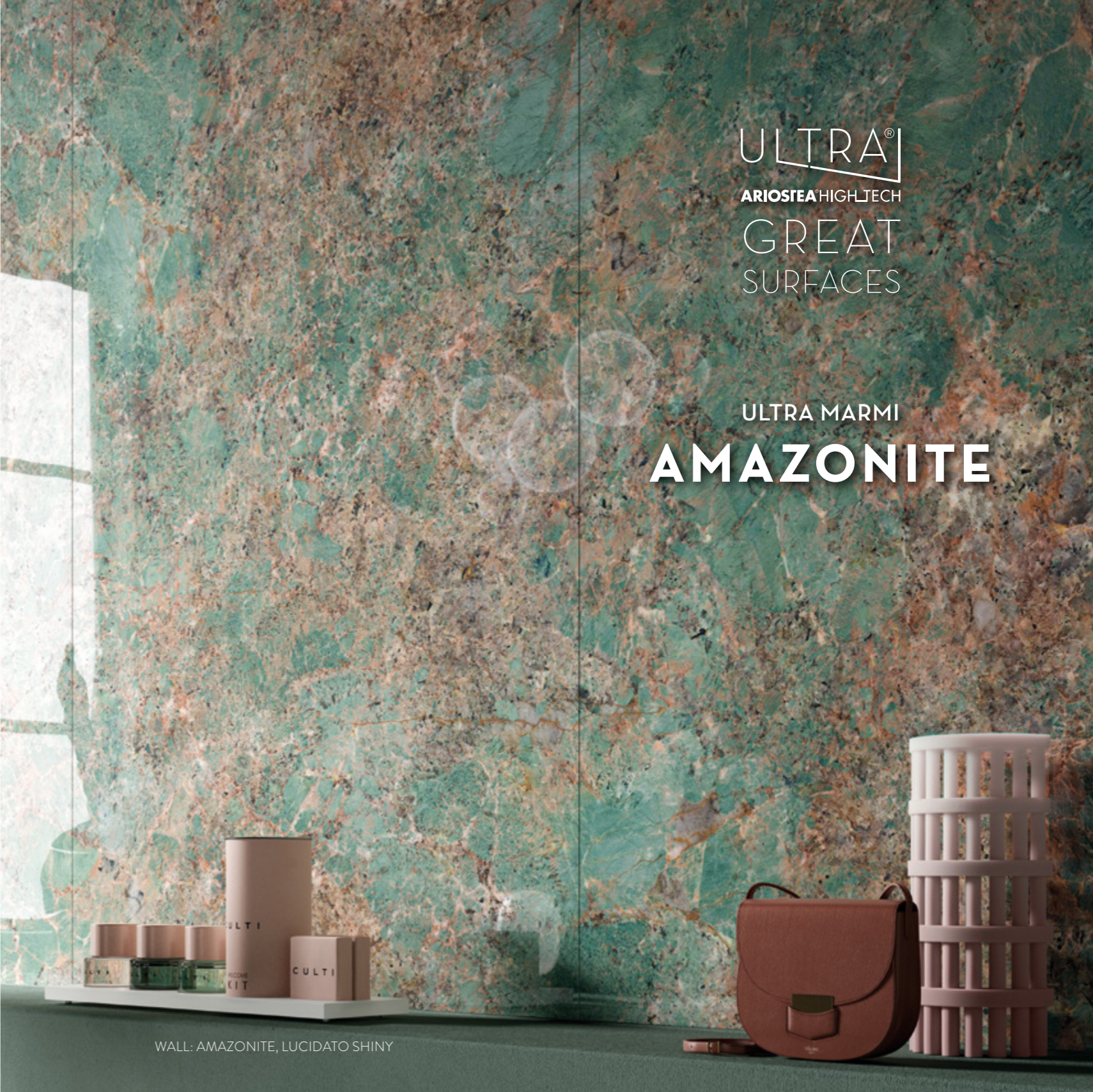
WALL: AMAZONITE, LUCIDATO SHINY