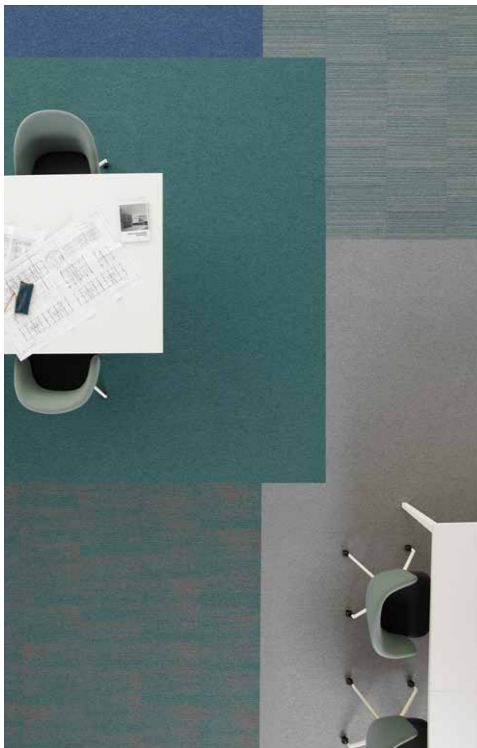
Essence 8012, 8413, 9515 / Essence Structure 7511 / Essence Stripe 8162