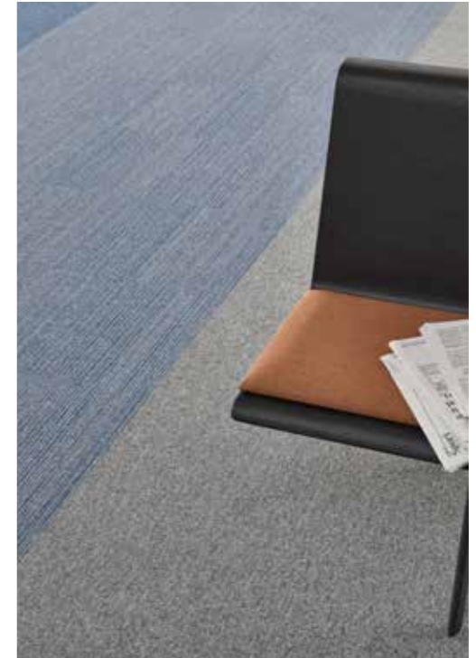
Essence 8413, 9005 / Essence Stripe 8522