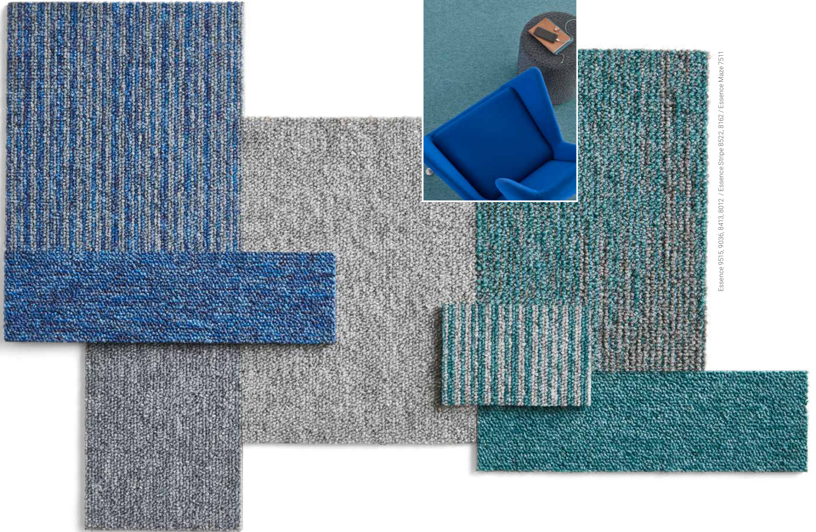
Essence 9515, 9036, 8413, 8012 / Essence Stripe 8522, 8162 / Essence Maze 7511